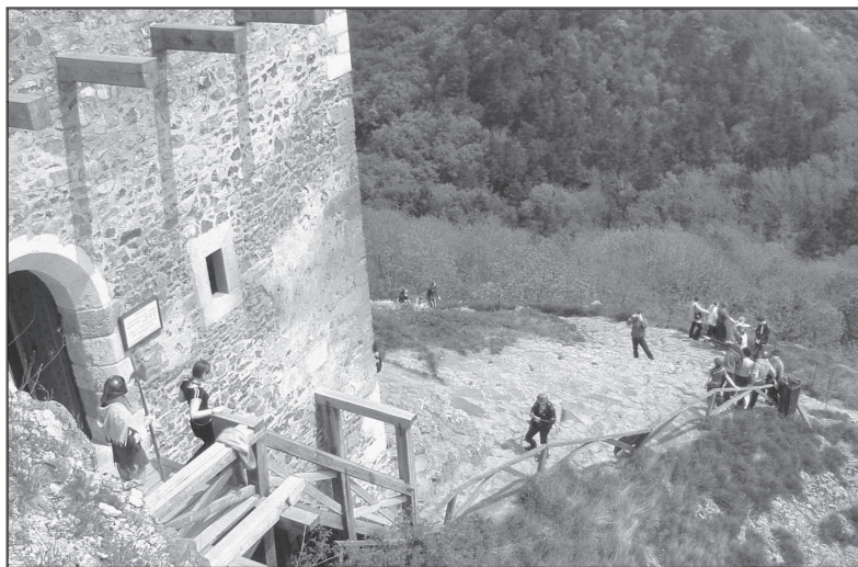
Pamiatkový cestovný ruch v hrade Füzér

Starostlivosť o pamiatky minulosti sa objavila v polovici XIX. storočia. V pozadí stál dynamický rozvoj urbanizácie a industrializácie, ktorý kládol dôraz na všetko nové a moderné. Tieto nové prístupy však vo veľkom ohrozovali historické hodnoty dávnej minulosti, a preto sa vo všeobecnosti dostala do popredia idea ochrany .