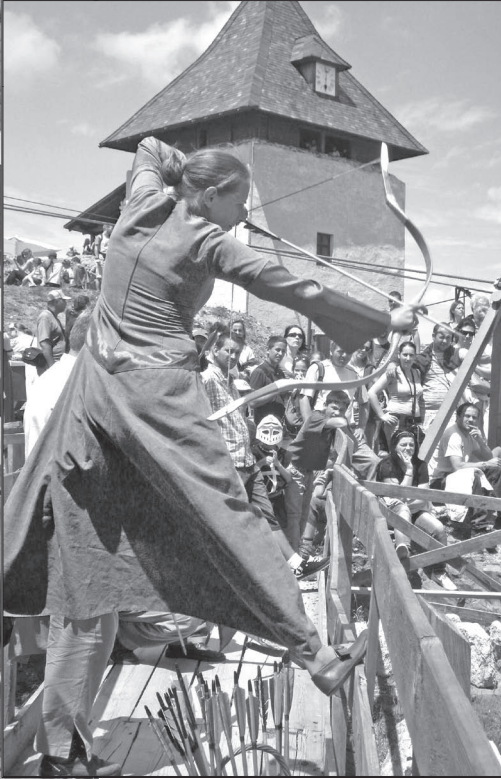
Podujatie kultúrno-historickej turistiky na hrade Füzér

Tie isté časti objektov majú aj určitú spoločenskú funkciu, vďaka posilneniu procesu socializácie. To znamená, že história a minulosť zohrávajú dôležitú funkciu pri odovzdávaní spoločenských noriem a pravidiel nasledujúcim generáciám.