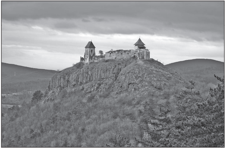
Hrad Füzér zo strany Kopaszky

V roku 1676 dvorná komora vydala príkaz na zbúranie hradu. Tým sa historická rola füzérskeho hradu skončila. V roku 1686 sa hradné panstvo dostáva do vlastníctva rodiny Károlyovcov.