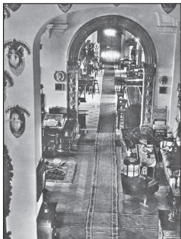
Foyer kaštieľného hotelu