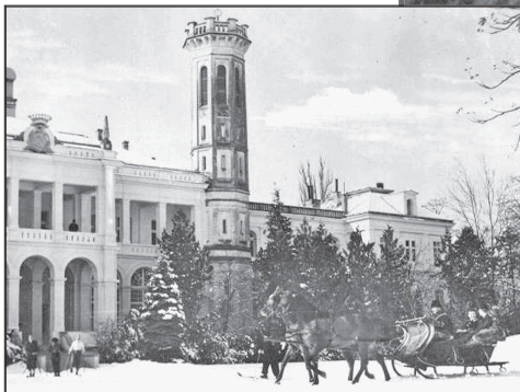
Zimná sankovačka v kaštieľnom hoteli vo Füzérradványi.