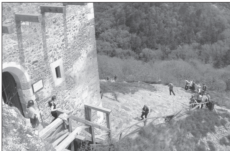
Műemléki turizmus Füzér várában

új események azonban nagymértékben fenyegették a történelmi múlt értékeit és ennek következtében került előtérbe a védelem eszméje.