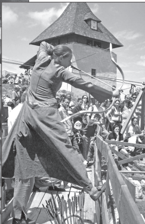
Örökség-turisztikai rendezvény Fü- zér várában

Füzéren a várbeli térben jellemző kulturális események elsősorban az örökségi rendezvényekhez tartoznak, kulturális jellegű rendezvények inkább a településeken jellemzőek. A várbeli hagyományőrző eseményeknek a célja az egykori kulturális tradíciók bemutatása a szélesebb közvélemény számára, demonstrálandó a történelmi értékeket. Itt emelendő ki a térség „zászlóshajó” fejlesztése, a füzéri vár turisztikai hasznosításának kérdése, melyhez egyben hagyományőrző csoportok tevékenysége is kapcsolódik.