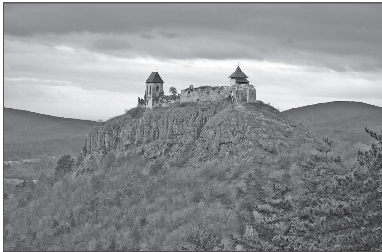
Füzér vára a Kopaszka oldaláról

1676-ban az udvari kamara utasítást adott a vár lerombolására. Ezzel Füzér várának történelmi szerepe lejárt, a hozzátartozó váruradalom a 1686-ban a Károlyi család birtokába került.