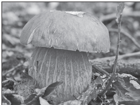
Ízletes vargánya vagy úrigomba (Boletus edulis).

A LEADER egy „közösségi kezdeményezés az életképes vidéki közösségekért”. Az Európai Unióban mindenütt képviselt célja, hogy alulról építkezve partnerségi alapon átalakítsa a kistérségek önkormányzati, vállalkozói és civil szféráinak gondolkodásmódját. Az eddigi tapasztalat azt mutatja, hogy a LEADER jóvoltából a partnerség, a közös érdekek felismerése mentén kialakuló összefogás lép az elszigetelt egyéni, olykor egymást átfedő, esetenként akár akadályozó törekvések helyére.