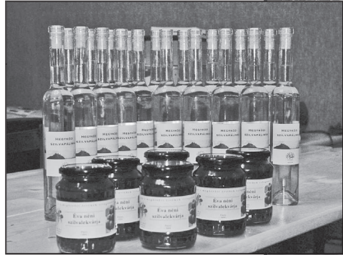
Helyi termékek (hegyközi pálnika és szilvalekvár).

Egy meghatározott régióból leginkább a régió belül megjelenő termékek, helyi termékek, legyenek azok akár turisztikai programok, rendezvények, vagy a térségben termelt és akár „natúrbotban” megvásárolható kézműves termékek, házilag készített, feldolgozott élelmiszerek (lekvár, szörp, dióbél stb.), melyek natúrpark termék címkével ellátva kerülhetnek forgalomba, mindez minőségi garancia is lehet az ökológikus eredet vonatkozásában. Ezt a garanciát erősítheti meg a „ natúrpark termék címke ”, mint marketing elem (helyi termék).