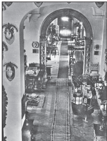
Foyer a Kastélyszállóban