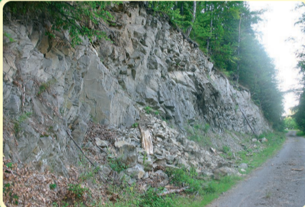
Úsek cesty medzi odpočívadlami č. 5. a 6.