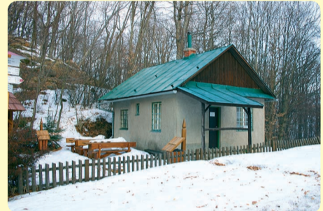
Odpočívadlo Malý Milič (SK)

Vlašské lúky, územie s osobitným stupňom ochrany