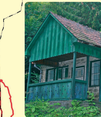
Lesnícka chata na lúke Csata

Vlašské lúky, územie s osobitným stupňom ochrany